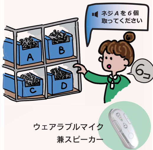
ウェアラブルマイク 兼スピーカー

作業指示ガイダンスを耳で聞き、 発話で実績登録します。 指示書は不要、 ペーパーレス化にも貢献します！